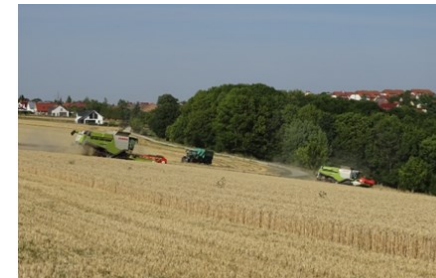
Mit über 400 PS ziehen die Mährescher, mächtige Staubwolken aufwirbelnd, ihre GPS-gesteuerten schnurgeraden Bahnen.

Bei eigentlich idealem Erntewetter –es hatte seit Wochen nicht geregnet und die Temperatur näherte sich z.T. der 30° C- Grenze- zogen die hochmodernen Claas Lexion 750 -Mährescher der Agrargenossenschaft Altengönna über die im Westen Cospedas gelegenen Winterweizenschläge des Weidigt.