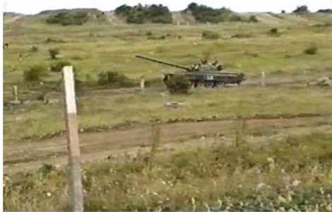
Ein T-55 in voller Fahrt. Im Hintergrund drei Auffahrampen zur Hochfläche.

Die Videoaufnahmen entstanden am 17.08.1990.