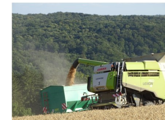
Ihr Korntankinhalt (> 10000 l) wird während ununterbrochener Mahd in die Annaburger Umladewagen gedrückt und von diesen in die bereit-