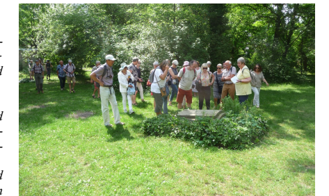
Gemeinsamer Spaziergang über Jenas geschichtsträchtigen Johannisfriedhof.