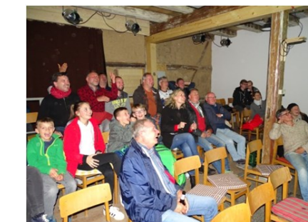
Unbeschreiblicher Jubel für die deutsche Mannschaft in der Scheunenbühne- Leider der letzte für die WM 2018

Ein besonderer Höhepunkt war die Liveübertragung des WM-Länderspiels Deutschland-Schweden in der Scheunenbühne. Groß war der Jubel beim deutschen Sieg in letzter Minute.