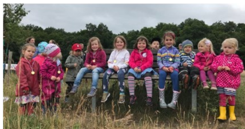
So sehen glückliche Schatzsucher aus.

Die „Großen“ vom HVC-Mitglied W. Biewald mit Detektivausweisen ausgestattet, durchforschten das Gelände zwischen Kugelleig am Grünen Kranz zur Nachtigall und dem Napoleonstein.