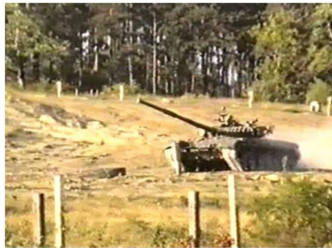
Ein T-80 hat mit infernalischem Getöse die Kurve unmittelbar neben dem Apoldaer Steiger genommen.

Zur Erinnerung: Die Windknollenhochfläche diente seit 1937 der Wehrmacht als Artillerie-Exerzierplatz und im 2. Weltkrieg als Standort der „Steigerflak“. Sie wurde nach der deutschen Kapitulation als Panzererprobungsgelände der Sowjetarmee weiter genutzt.