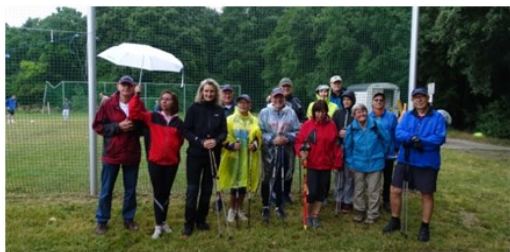
Die Walker – trotz leichten Regens unverzagt.

Ein Post von FRANK BERLET informierte: Auch in diesem Jahr machte sich wieder eine wackere Truppe von 14 Walkern auf die leicht vernieselte Strecke. In diesem Jahr war der Ehrgeiz bei einigen besonders groß, sodass sogar eine verlängerte Runde absolviert wurde. Die Walker hatten es gegenüber den Turniersmannschaften etwas leichter, da sie sich den Wetterbedingungen besser anpassen konnten, wie auf dem Foto zu sehen ist. Im Ziel angekommen, schmeckten Bier und Bratwurst umso besser.