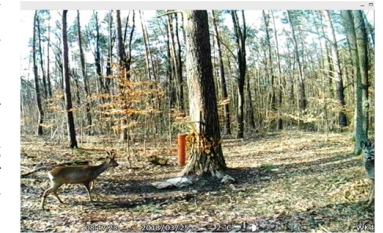
Im Hasental 25.3.18-8:47

Das erlegte Wild ist Eigentum des Jagdpächters. Er kann es für den Eigenbedarf behalten oder vermarkten. (Ein Kilo Rehwild in der Decke erbringt 3,50 €, bzw. Schwarzwild in der Schwarte 2,50 €).