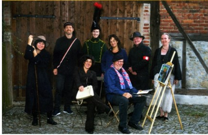
Das Ensemble vor dem Tor der Scheunenbühne (Repro aus dem Werbe-Faltblatt)

Die Ankündigung „Der Heimatverein Cospeda e.V. präsentiert das Theaterstück Bilderrausch und Zeitensprünge –Ein Dorf und seine Geschichte(n)“ weckte bei den Cospedaern große Neugier.