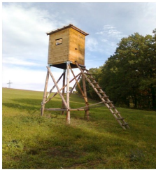
Hochsitz Nr. 6 auf der Neuen Sorge

Sicherheit hat im Jagdwesen höchste Priorität. So haben die neuerdings auch in unserer Gegend an Straßenbegrenzungspfosten angebrachten blauen Wildwarnreflektoren folgende Bedeutung: Beim Herannahen eines Fahrzeuges in der Dämmerung bzw. in der Nacht soll das