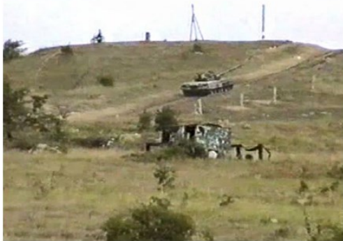
Ein Panzer vom Typ T-55 erklimmt die Steilstufe des Windknollen. Im Mittelfeld ein alter Eisenbahnwaggon.