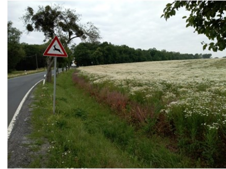
Mitte Juni 2018. Feld nördlich der Straße Closewitz-Lützeroda. Baut die Agrargenossenschaft Altengönna hier Kamille an?

Grund: Auswinterung oder lokale Trockenheit [Spätfröste, Blütenwelke]. Die im Boden verborgenen Kamillesamen waren in der Lage, die entstandenen Freiräume zu nutzen.