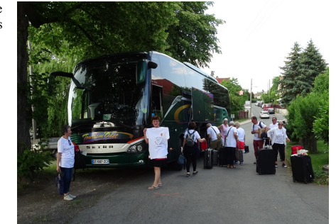
Ankunft der französischen Gäste unter Cospedas Linden.