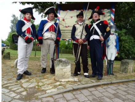
Friedlich vereint: Französische Fusiliere, napoleonischer Kaisergardist und preußischer Infanterist.

„Die Cospedaer Vereine und das Museum 1806 laden ein zum SOMMERFEST AUF DER FESTWIESE am 23.6.“ so prangte es in großen Lettern in der Straßen-S-Kurve des Rosentals. Viele aufwändige Vorbereitungen (von zumeist immer denselben) Ehrenamtlichen waren getroffen, nichts konnte schiefgehen-bis auf das Wetter. Nach wochenlangen prächtigen und zu trockenem Sommerwetter war für das Festwochenende Regen angesagt. Er kam wirklich, glücklicherweise nur am Vormittag. (Siehe Beitrag Sportfest).