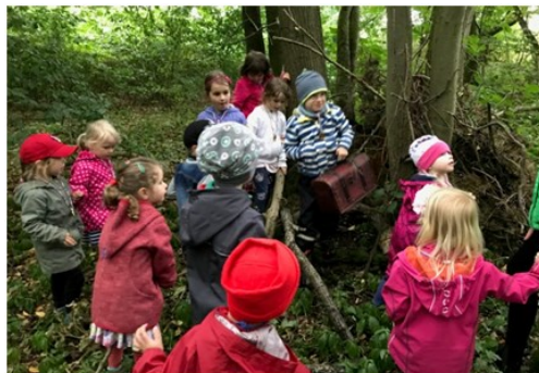
Hurra! Der Schatz ist gefunden!

Die „Kleinen“ zogen mit Evelyn Schmidt in den Märchenwald des Baiersberges, um einen Schatz zu heben: Fünfzehn unerschrockene Goldsucher stellten sich zum Sommerfest den vielfältigen Aufgaben der „kleinen“ Schatzsuche. Die Vorschulkinder lösten Märchenrätsel, orientierten sich anhand von Fotos und Kompass, balancierten auf Ästen, gingen auf Spurensuche wilder Tiere, bewältigten eine Slalomstrecke, übten sich im Zielwurf und schossen Raketenballons in den etwas verregneten Himmel, bis endlich der Schatz gehoben werden konnte. Verdient haben es sich die gut gelaunten, sportlichen und schlauen Kinder. Wir freuen uns im nächsten Jahr auf ebenso viel Interesse.