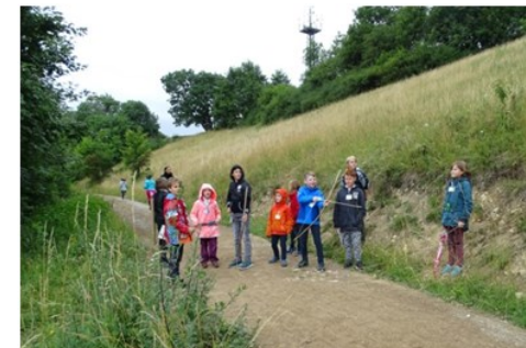
Die Gruppe, deren Pfeil am weitesten flog, bekam einen Sonderpunkt.

Unter sportlichem Aspekt wurden ferner Bogen-Weitschießen und ein Wettlauf zur „Feuerwehrbank“ durchgeführt.