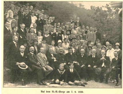
Wahl beim 22.-Vj-Bezug am 7. 9. 1930.

Welche große Anteilnahme dieses Ereignis fand, zeigt das im o.g. Mitteilungsblatt wiedergegebene Gruppenfoto.