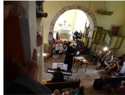
Aufführung des „Luther-Musicals“ mit über 20 Mitwirkenden in der Kirche.