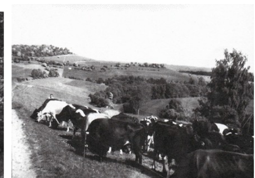
Kühe auf der Weide im Gröthen.

Im Hochsommer 1946 bekam ein Ochse bei Feldarbeiten einen Hitzschlag. Der Ochse, der etwa 20 Zentner wog, wurde mit riesigem Aufwand mittels Rollen vom Feld auf den Hof gebracht und mit einem Flaschenzug aufgerichtet. Doch die viele Mühe hatte sich leider nicht gelohnt, denn er musste dann doch geschlachtet werden.