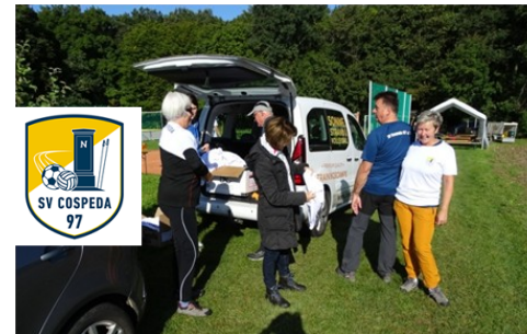
Bei der Verteilung der kostenlosen T-Shirts mit dem neuen SVC-Logo.

Nach gut drei Stunden Spaß und bewusstem Üben hatten die Körper genügend Kalorien verbraucht, um durch Würste und Getränke wieder aufgefüllt zu werden. Der Beifall galt allen Helfern aus den Sektionen Fußball, Volleyball und Lauf / Nordic Walking.