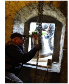
Obwohl die Glockenbasis breiter als die Fensterweite ist, schafft der erfahrene Meister mit einem Trick das Einfädeln der Glocke.

Für alle Gäste war der Cospedaer Glockenaufzug ein Erlebnis, dass sich kaum wiederholen dürfte.