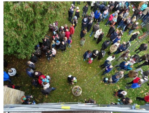
Gespannt warten die Cospedaer darauf, dass die Glocke nach oben schwebt.