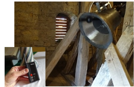
Die Neue, voll in Aktion. Sichtbar sind auch die Schallluken der neuen Fensterläden. Kleines Bild: „Handy“ mit dem fernbedient die zwei Glocken in Gang gesetzt werden können.

Zuerst wurde die alte Glocke – nunmehr per Fernbedienung – zum Klingen gebracht, danach die neue. Beide Glocken vereinten sich in einem beeindruckenden festlichen Geläut, das fortan zur Ehre und Freude Gottes und der Menschen erklingen wird. Dr. Bernd Zickler