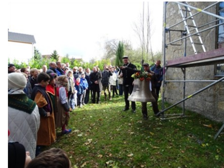
Glockenmeister Ruft dirigiert den Aufzug

Viele der zahlreichen Besucher überzeugten sich vom Wohlklang der neuen Glocke durch Anschlagen mit einem Plastikhammer.