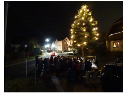
Dicht gedrängt um den sangesfreudigen Chor: Über hundert Cospedaer erfreuen sich an der Adventsstimmung.