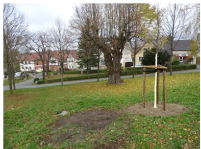
Möge der neugepflanzte Baum auch mindestens 100 Jahre unsere Nachfahren erfreuen!