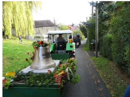
Mit festlich geschmückter Glocke vom Unterdorf über fünf Haltepunkte bis zur Kirche.

Von einem mit ökumenischem Bläserchor besetzten Begleitfahrzeug erklangen Lutherchoräle. Sie sollten auch einstimmen auf das um 10:30 Uhr in der Kirche aufgeführte „Luther-Musical“.