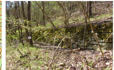
Auf anstehendem Wellenkalk gegründete Trockenmauer. Ca. 1,5 m hoch.

Überrascht wird der Wanderer, wenn er den mittleren Teil des Tales erreicht hat und den Blick auf die Westseite richtet. Hier fallen solide gefügte Trockenmauern, als Zeugen eines älteren Weinberges auf.