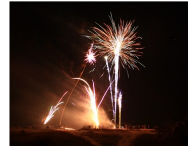
Silvesterfeuerwerk am Napoleonstein, 1.1.17.