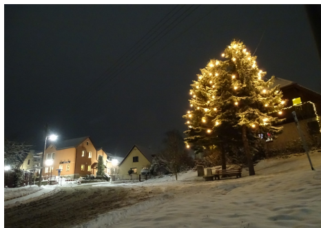
1. Advent- nur kurzzeitiger Winterzauber am Cospedaer Lichterbaum.

Cospedas Lichterbaum war am 5. Dezember zwar nicht so stimmungsvoll in Weiß gehüllt wie ein paar Tage zuvor am 1. Advent. Dennoch hatten sich weit mehr als hundert Cospedaer aufgemacht, um sich mit dem einheimischen Chor bei Glühwein, Weihnachtsgebäck und Bratwurst und gemeinsamen Gesang weihnachtlich einzustimmen.