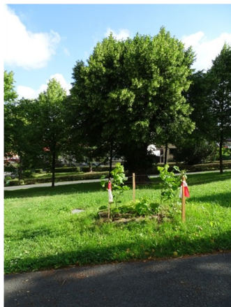
Leider! Vergeblicher Rettungsversuch der alten Linde.