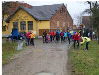
Gleich geht's richtig los! Silvesterlaufabschluss im gastfreundlichen Garten „Bergstein“.

Ich bin fast sicher, dass auch an diesem Jahresende ein Cospedaer Silvesterlauf stattfinden wird.