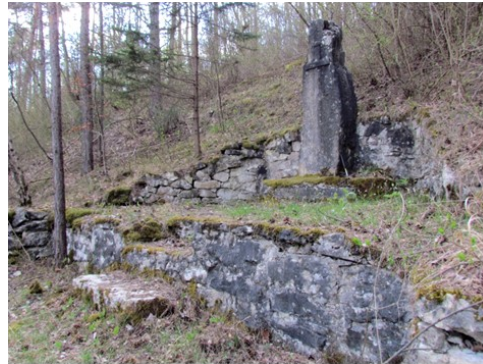
Das in der Lugrid-Karte eingetragene Kriegerdenkmal am Westhang der Nasenkoppe. (▲)

Selbst bei den nach diesen Steinmalen befragten „Altcospedaern“ hatte –mit einer Ausnahme – niemand Kenntnis von diesen Monumenten, geschweige dem von ihren Urhebern.