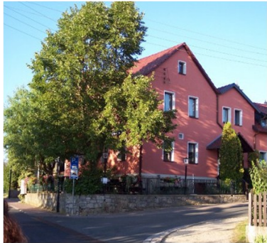
Die Gasthauslinde noch in alter Pracht

Seit einigen Jahren war abzusehen, dass das „Markenzeichen“ des weit über Cospedas Grenzen beliebten Gasthauses, eine weitausladende prächtige Linde, mit der vitalen Kraft ihrer Wurzeln das Mauerwerk an der Ecke Jenaer Straße/ Closewitzer Weg sprengen würde.