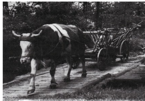
Ein Ochsengespann in Cospeda

Zum Gehöft gehören ca. 13 ha landwirtschaftliche Nutzfläche. Der Bauernhof wurde im Haupterwerb betrieben. Schwerpunkt bildete dabei die Viehhaltung mit Milchkühen und Schweinen, wobei das Futter, das die Nutztiere brauchten, auf den eigenen Feldern angebaut wurde. Auf dem Hof gab es auch Pferde und Ochsen als Arbeitstiere.