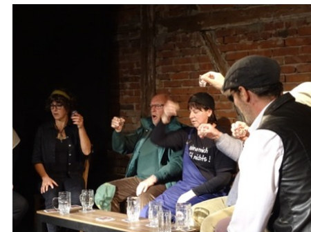
Prost! Der Heimatverein tagt.