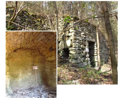
Weinberghaus aus Terebratelkalksteinen. Grundfläche 6 x 3 m; Innenraum 2,5 x 2 m, davon 0,7 m in den Wellenkalk eingehauen (kleines Bild).

Was aber besonders erstaunt: hier ist eines der schönsten Jenaer Weinberghäuschen zu sehen.