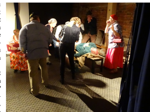
Welch Entsetzen! Liegt da nicht eine Leiche?