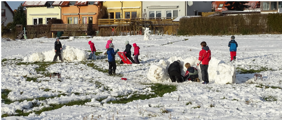
Wenn er auch nur kurz war, der Wintereinbruch Ende Januar in Cospeda, die Kinder vom Mühlenwegviertel wussten ihn zu nutzen