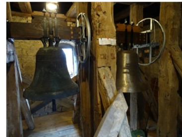
Erstmals in Cospeda: Die Glocken bewegen sich zur Jahreswechsell-Mitternacht wie von Geisterhand.

Seit vielen Jahren war es Tradition, das neue Jahr mit zehn Minuten langem per Hand erfolgtem, schwingvollen Läuten der über 500-jährigen Glocke zu begrüßen (nicht selten hatten sich hierzu einige Gemeindemitglieder mit Sektglas und Wunderkerzen versammelt, gelegentlich erscholl auch eine Posaune). Nachdem mit der zweiten Glocke ein automatisches Läutwerk installiert wurde, hat die IT-Technik die Glockengröße zum Jahreswechsel aktiviert: 5 min vor Mitternacht läutet die alte und bis 5 min nach Mitternacht die neue Glocke. Die Botschaft bleibt: Es möge ein gutes Jahr werden!