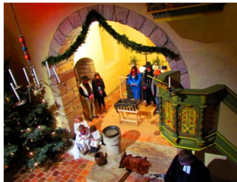
„Uns ist ein Kindlein heut geboren.“ Gelungene Einstimmung in das Weihnachtsfest.

Mitgliedern beider Scheunenbühnen (inklusive des Pfarrers, der ja auch einer der Scheunenbühnen-Mimen ist) gelang es (sicherlich kurzfristig) die allbekannte Geschichte von der Geburt des Kindes im Stall zu Bethlehem sehr eindringlich und farbenfreudig darzustellen.