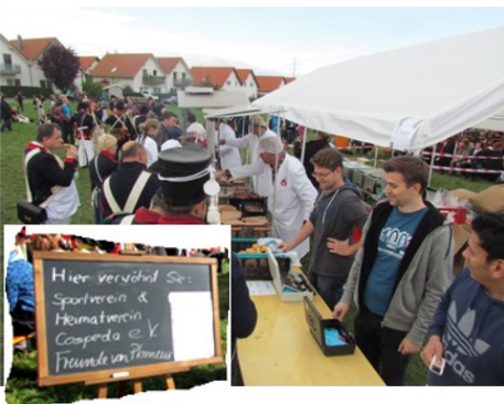
Die Cospedaer Vereine können die Nachfrage kaum befriedigen. 1600 (!) Bratwürste, 325 Rostbrätchen und unzählige Crepes gehen hier über den Tresen.