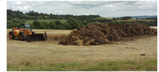
Der gewaltige Haufen aus sehr nährstoffreichen Schafsdung vom Jägerberg war nach wenigen Tagen abgeräumt (Juli 2016).

Einige glaubten noch, den damals in den Ort ziehenden spezifischen Düngegeruch in der Nase zu haben, andere meinten, dies gehöre nun mal zum Dorf. Ein Fledermausfreund mutete gar, die mit dem Misthaufen verbundene Fliegenwolke wäre sicherlich ein kuli-