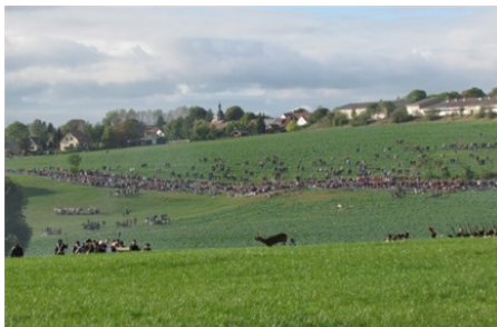
Ein von Schlachtenlärm aufgeschrecktes Reh hetzt über die Wiese. Im Hintergrund bevölkern hunderte Zuschauer die Winterrappschläge der Gönnatal Agrar-AG.

Die Mühlen der Vereine waren nicht umsonst. Ihre Kassen konnten einen erfreulichen Zuwachs verbuchen.