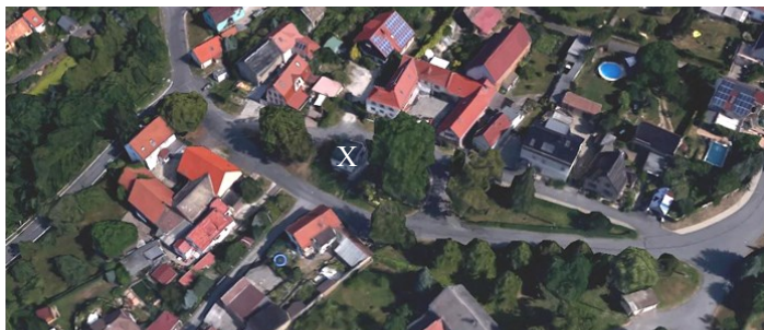
Diese Google Earth- Aufnahme zeigt das Areal um das Feuerwehrgerätehaus Cospeda(X). Hier soll nach den Vorstellungen des Ortschaftsrates ein neues Gemeindehaus entstehen.