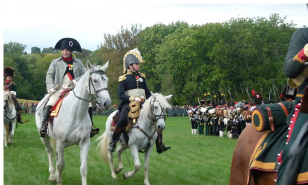
Napoleon inspiziert seine Truppen