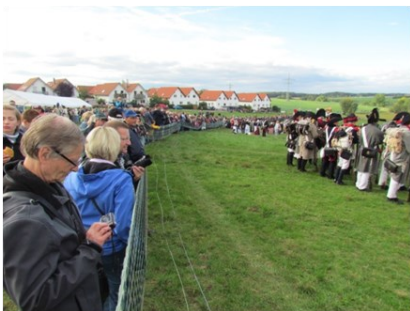
Etwa 7000 Zuschauer folgen den bunten Darbietungen.