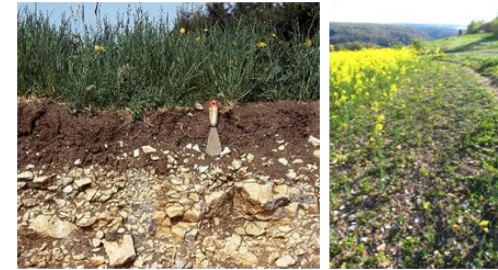
anteil zu erkennen (Bild rechts).

Er ist nur mit hohem Materialverschleiß an Maschinen zu bearbeiten. Rendzina im Muschelkalk, ein flachgründiger zu Trockenheit neigender steiniger Lehmboden auf Kalkstein. Auf dem Rapsfeld unterhalb des Weges zum Bolzplatz ist durch Abschwemmung der hohe Stein-