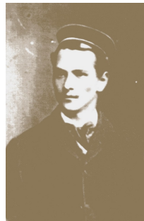
F. Wilhelm Demelius mit einem Lichtenhainer Kännchen. Zeitgen. Zeichnung. Repro aus /3/. Ein bislang nicht bekanntes Foto von F. W. Demelius.

Die nach altem Vorbild wieder entstandene Gedenktafel für den Cospedaer Friedrich Wilhelm Demelius am Haus Ballhausgasse 6.