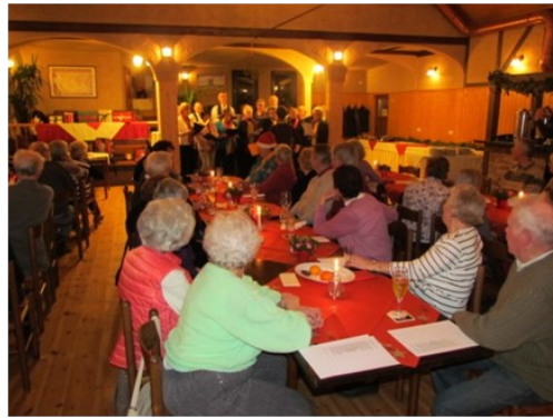
Immer wieder eine Freude, den Cospedaer Chor zu erleben.