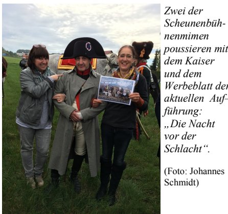
Zwei der Scheunenbühnenmimen poussieren mit dem Kaiser und dem Werbeblatt der aktuellen Auf-führung: „Die Nacht vor der Schlacht“.