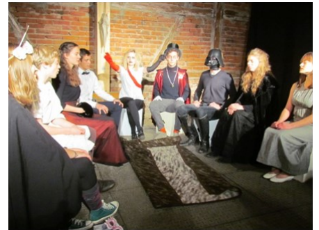
Ein buntes Konsortium, versammelt, um die Frage aller Fragen zu lösen.